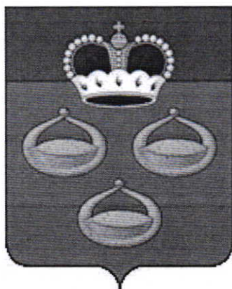
СХЕМА ВОДОСНАБЖЕНИЯ И ВОДООТВЕДЕНИЯ МУНИЦИПАЛЬНОГО ОБРАЗОВАНИЯ БОРИСОГЛЕБСКОЕ МУРОМСКОГО РАЙОНА ВЛАДИМИРСКОЙ ОБЛАСТИ

Приложение № 1 к постановлению администрации района от 05.09.2023 г. № 834